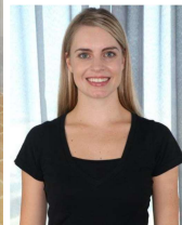
4" x 6"