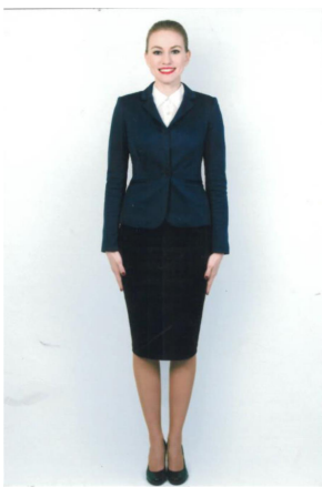
10cms x 15cms

Tendrá que proporcionar fotos de cuerpo entero y tamaño pasaporte en atuendo comercial y ropa casual.